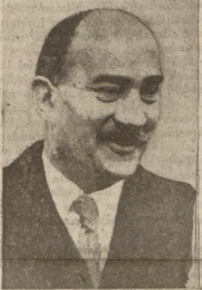
Suriyede Fransız büyük komutanı General Dentz

Vişi, Şam'daki kuvvetlerin 3 istikametden taarruza geçtiğini bildiriyor